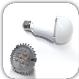
Commercialisation de produits finis